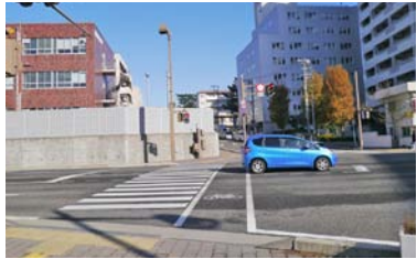
②「市役所前」バス停からの横断歩道