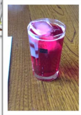
自家製のシソジュース！キレイな色です♪